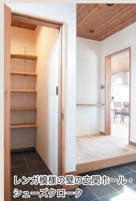
レンガ模様の壁の玄関ホール・シューズクローゼット