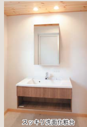
スッキリ洗面化粧台