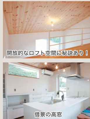
開放的なフロア空間に秘訣あり!