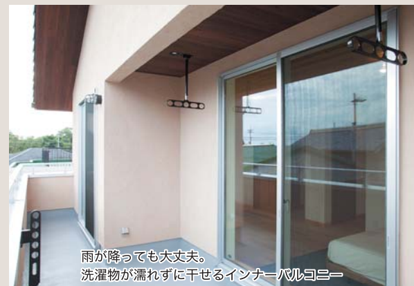
雨が降っても大丈夫。洗濯物が濡れずに干せるインナーバルコニー