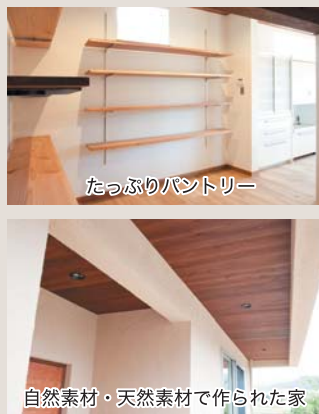
たっぷりパントリー